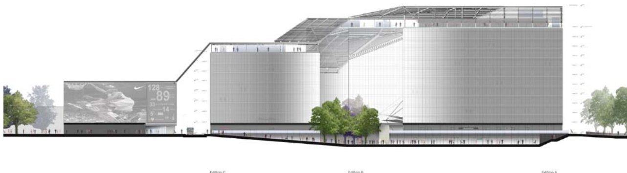
Prospetto Est dell'edificio

termiche poste sopra agli edifici di non dover operare sempre al massimo delle prestazioni, ma di dover sopperire a carichi inferiori in quanto l'ambiente risulterà meno gravato dai raggi solari. La ripartizione tra spazi aperti e chiusi crea direzioni nuove, possibili generatrici di assi urbani e percorsi prevalentemente pedonali. Vista da sud, la successione degli edifici presenta il parcheggio (900 posti auto previsti su sette piani), il blocco commerciale (un minimarket, una profumeria, un'agenzia viaggi, un negozio di parrucchieri, una filiale bancaria, un ristorante, una farmacia, ma anche l'ufficio postale e un asilo nido convenzionato con il Comune) e infine le due torri, riservate principalmente agli uffici del Comune. La piazza, più bassa rispetto al livello stradale, serve da accesso ai diversi comparti.